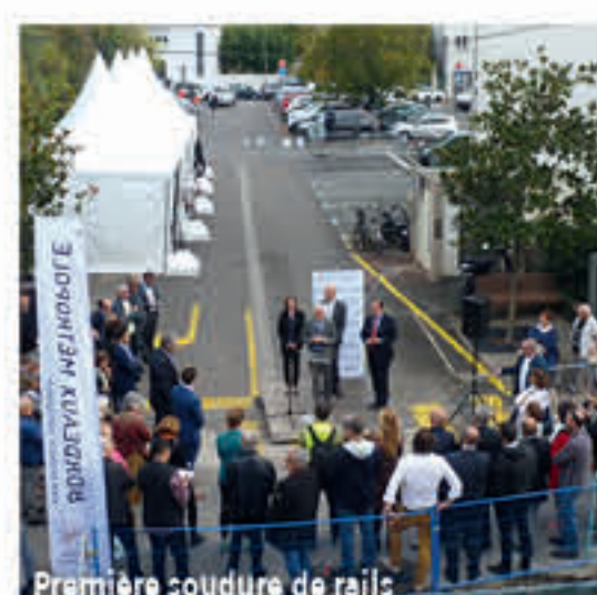
Première soudure de rails