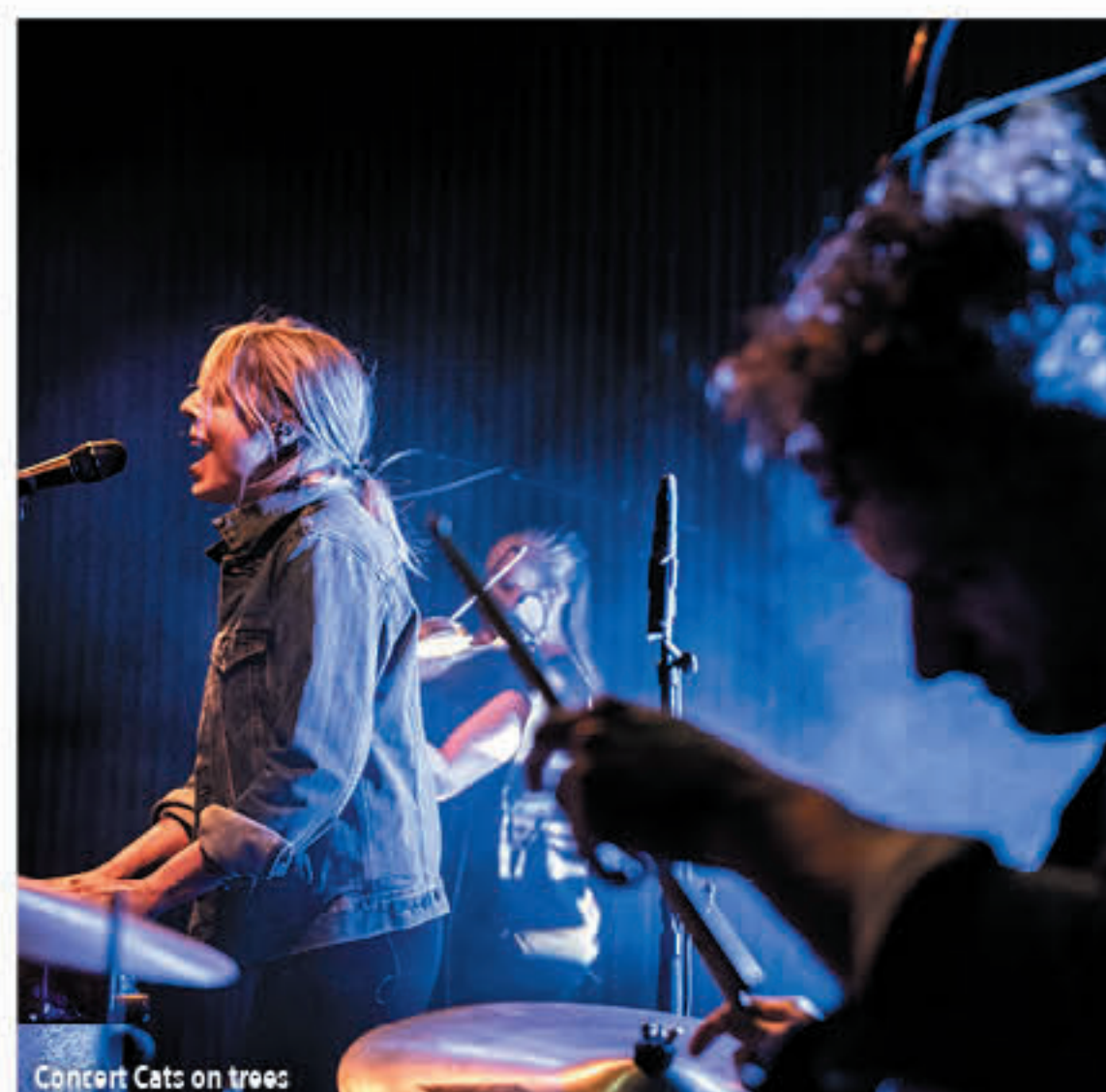
Concert Cats on trees