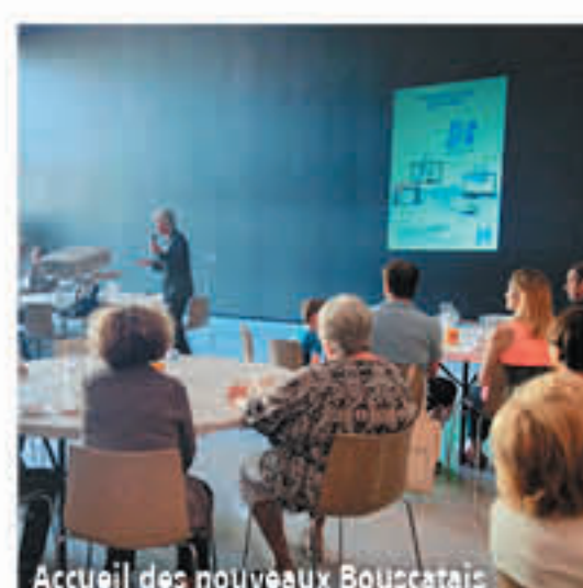
Accueil des nouveaux Bouscatais