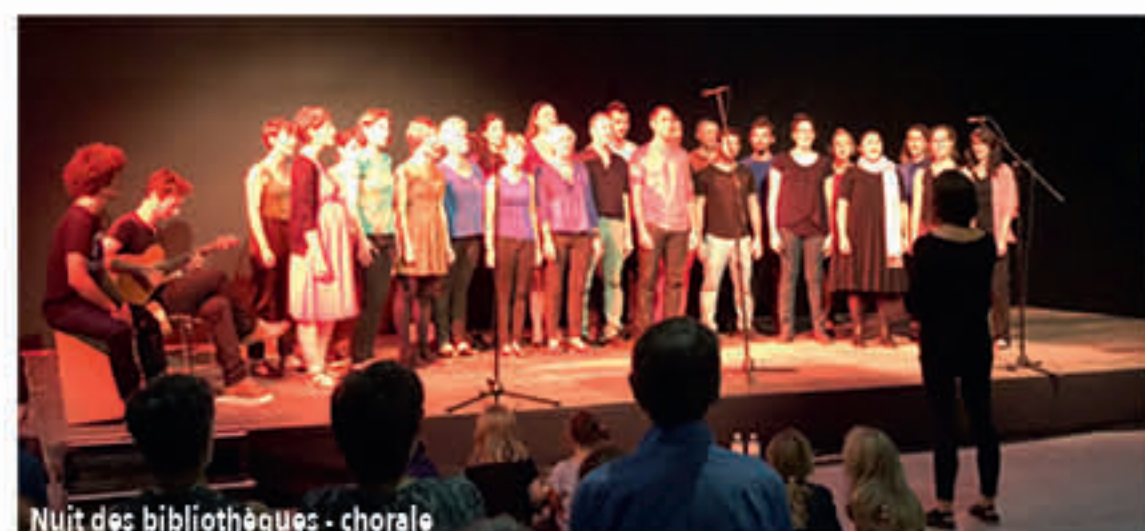
Nuit des bibliothèques - chorale