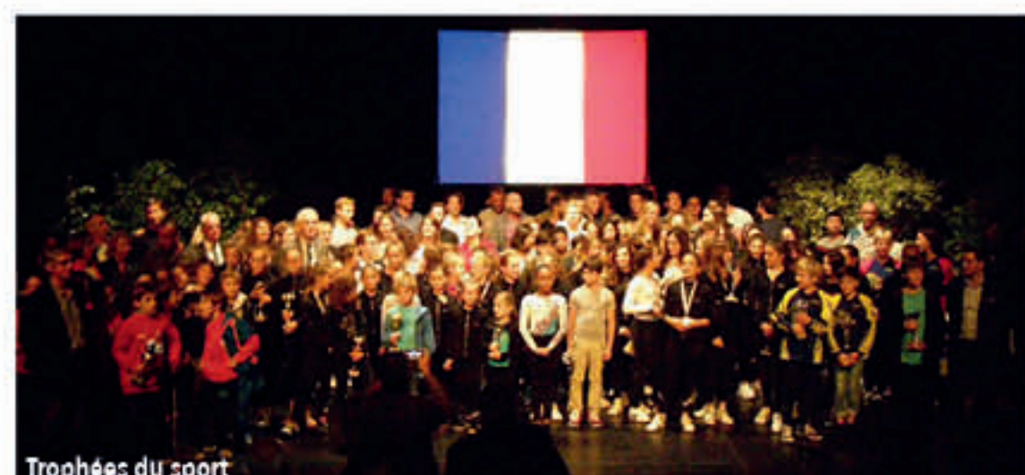
Trophées du sport