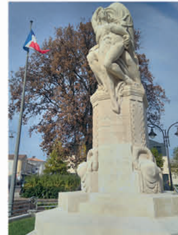
Le monument aux morts de la nouvelle « Place de la Paix »

Pour clôturer ce centenaire sous le signe de l'espoir et de la paix, plus de 150 enfants des écoles primaires du Bouscat participeront à la cérémonie officielle du 11 novembre. Une chorale éphémère accompagnée de l'Harmonie municipale chantera les hymnes français