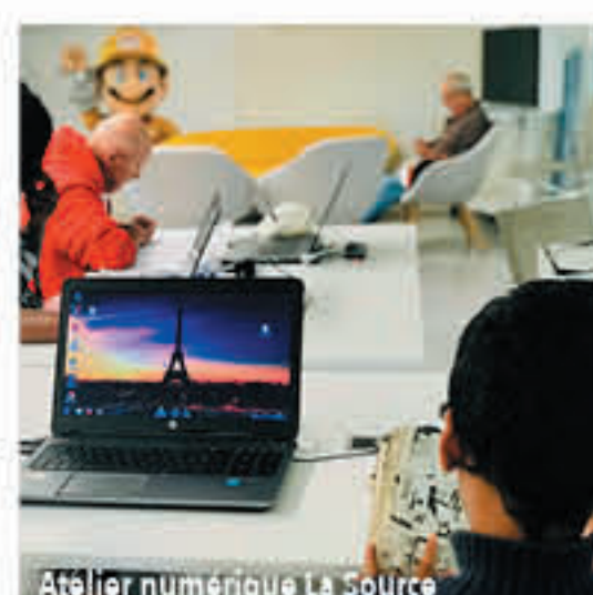
Atelier numérique La Source