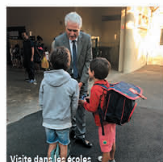
Visite dans les écoles