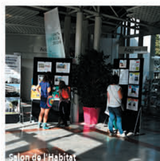
Salon de l'Habitat