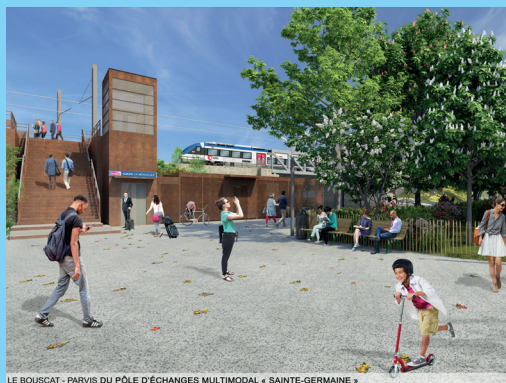
LE BOUSCAT - PARVIS DU PÔLE D'ÉCHANGES MULTIMODAL « SAINTE-GERMAINE »