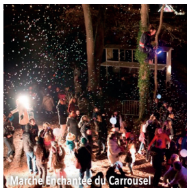
Marché Enchantée du Carrousel