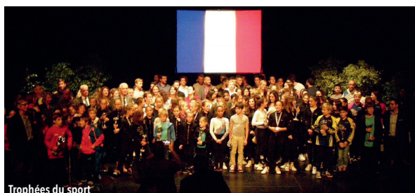
Trophées du sport