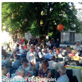
Pique-nique des bénévoles