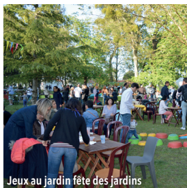
Jeux au jardin fête des jardins