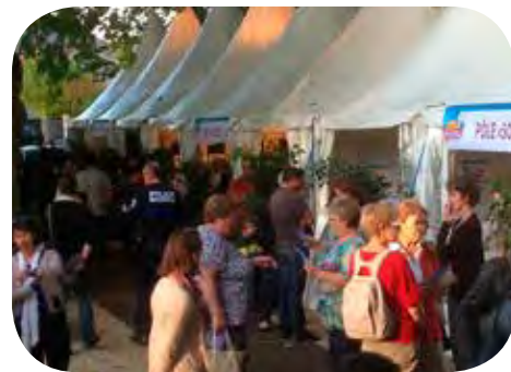
Salon de la vie locale 2013