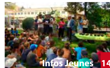
Infos Jeunes 14