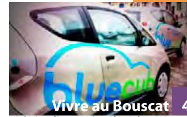
Vivre au Bouscat 4 Création d'une station BlueCub au Bouscat