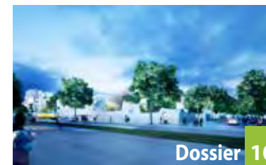
Dossier 10 Travaux : point d'étape