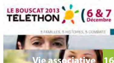
Vie associative 16