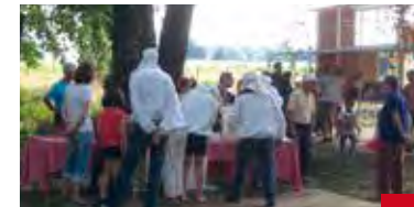
Développement Durable 8 Agenda 21 : première évaluation