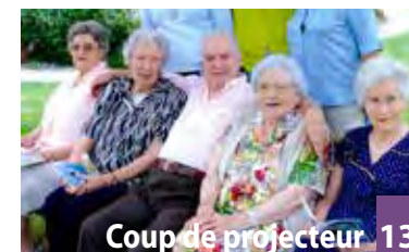
Coup de projecteur 13 Le pôle seniors